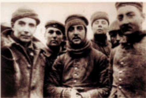
Groupe de soldats allemands avec deux Anglais, fraternisant à Ploegsteert, Belgique, le jour de Noël 1914.

On se faisait passer également chargeurs, boutons, journaux, pain.»